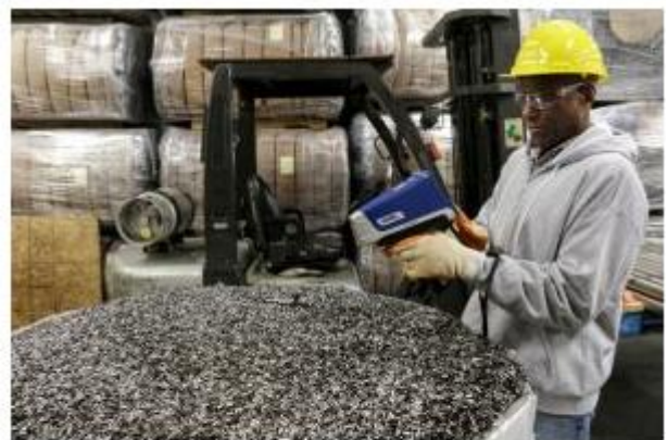
虽然废料场的环境可谓极为严酷，但是 Vanta 分析仪可以完全迎接这种挑战。

(MIL-STD-810G) 中的坠落测试，从而有助于防止仪器损坏。配备含 25 种或更多元素的标准软件包，可使用户快速测量各种合金和金属，例如：非铁性合金，低合金钢，铝合金和轻合金，铜合金，贵金属，汽车催化剂，电子元件，玻璃。