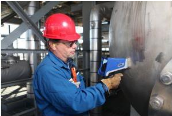
焊缝级别库有助于对焊缝进行快速检测。

组成合金的各种元素含量的微小变化，或者合金成份不纯，都会改变合金的强度重量比，以及合金的耐腐蚀性能，所以医疗器械的制造商会用 Vanta 对所用合金进行质量确认。