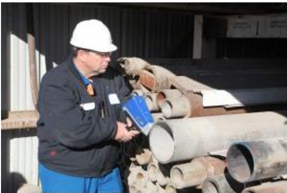
水管管道及其部件都受到严格的监管，制造商必须使其产品符合可允许铅元素水平的要求。