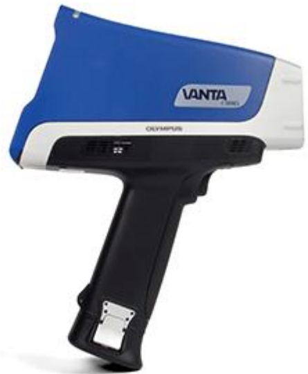
Vanta分析仪通过了从4英尺高处坠落的测试。