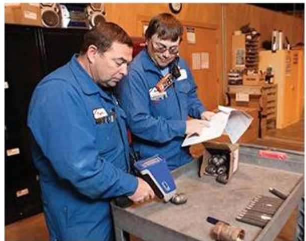
Vanta分析仪可为材料验证程序提供资产完整性信息。