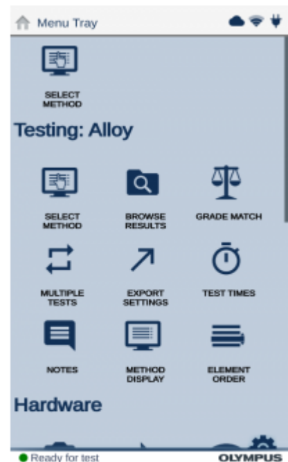
Vanta软件, 使用方便, 浏览快捷。